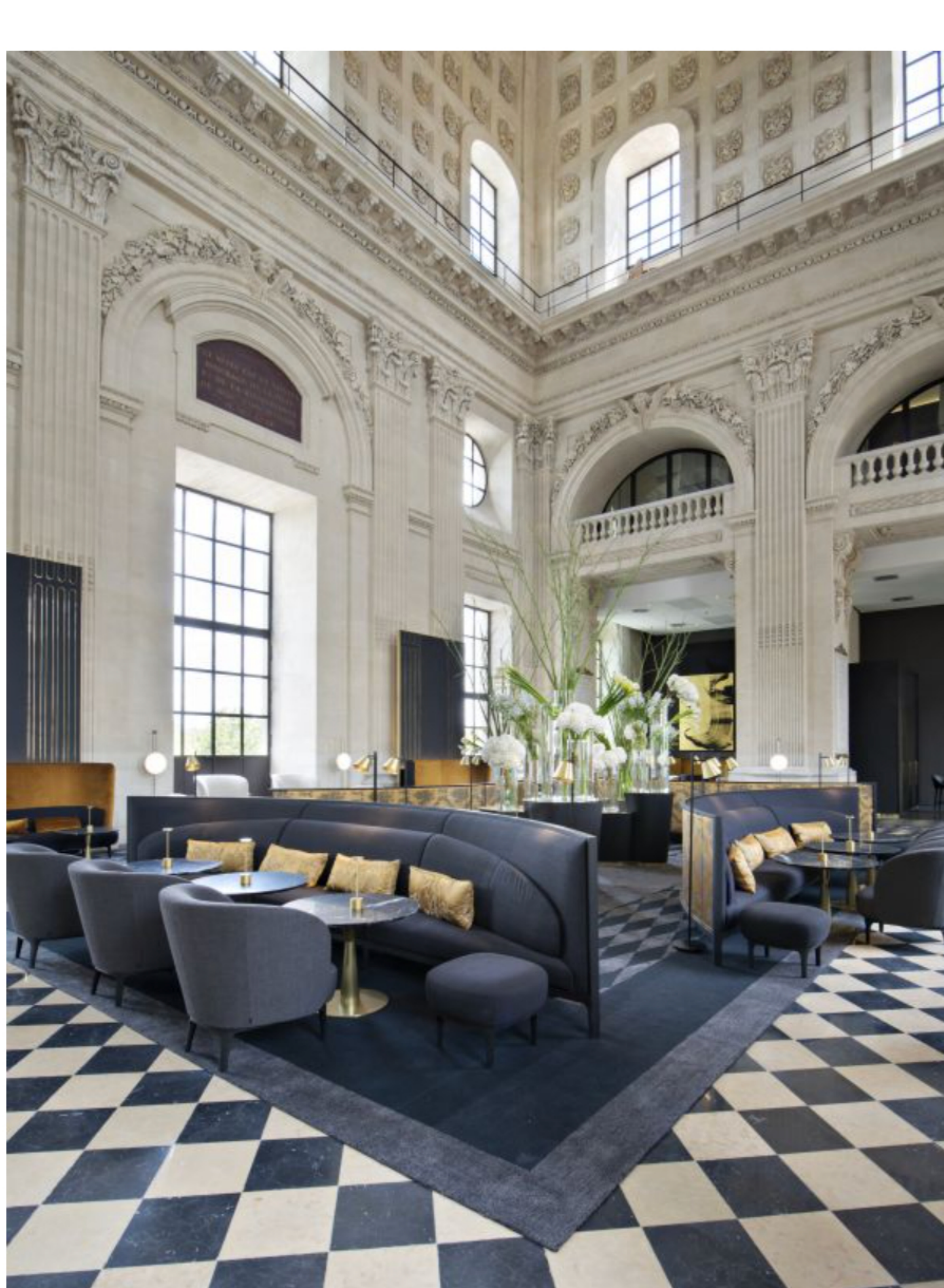
Intercontinental Hôtel Dieu, Lyon, France