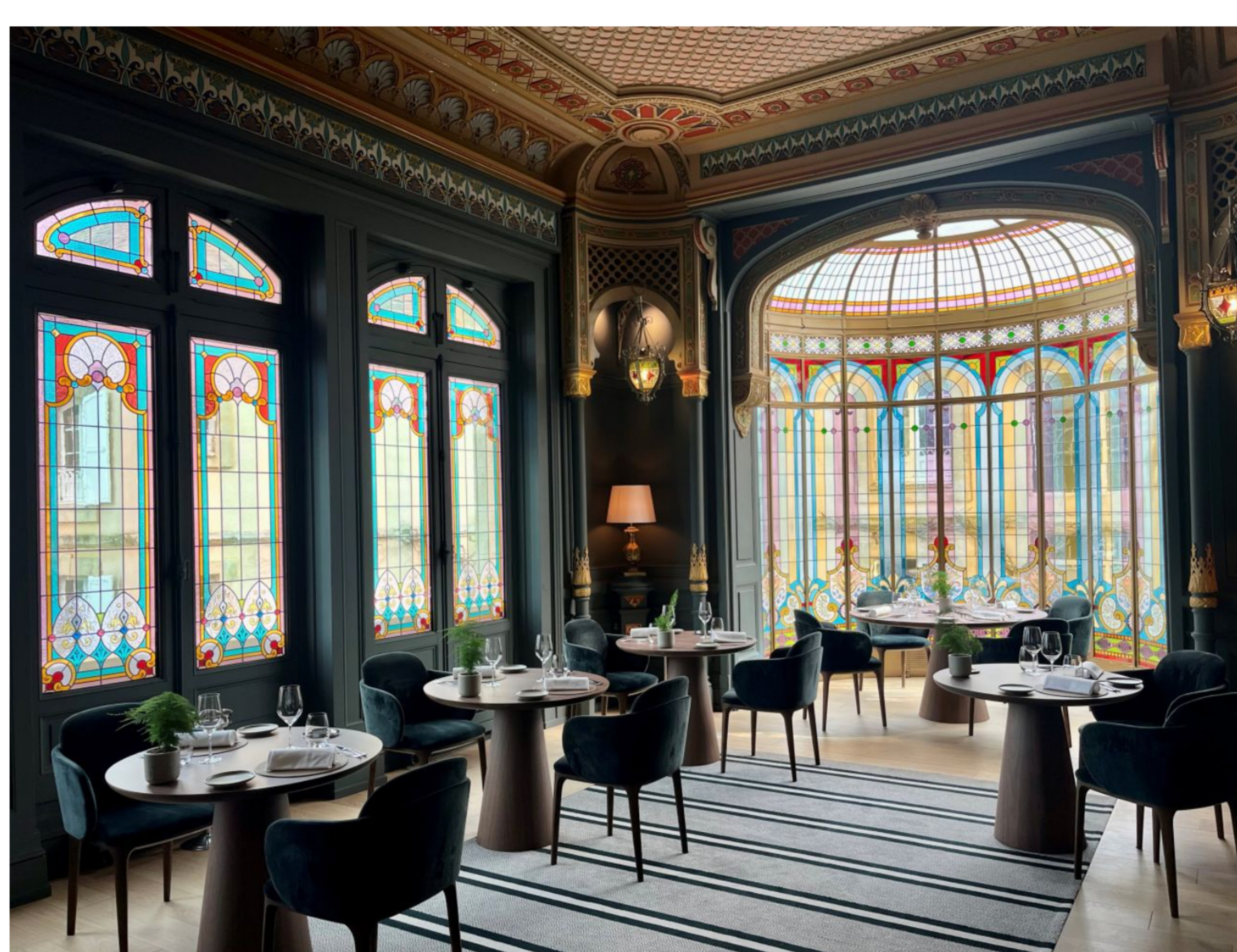
Salle à Manger Mauresque - Château Hôtel Grand Barrail, Saint-Émilion, France

Chaque projet est un peu comme l'un de ses propres enfants ; chacun est différent, mais l'on manque de discernement pour voir leurs qualités comme leurs défauts. Petit ou grand, chaque projet conserve une place dans mon cœur.