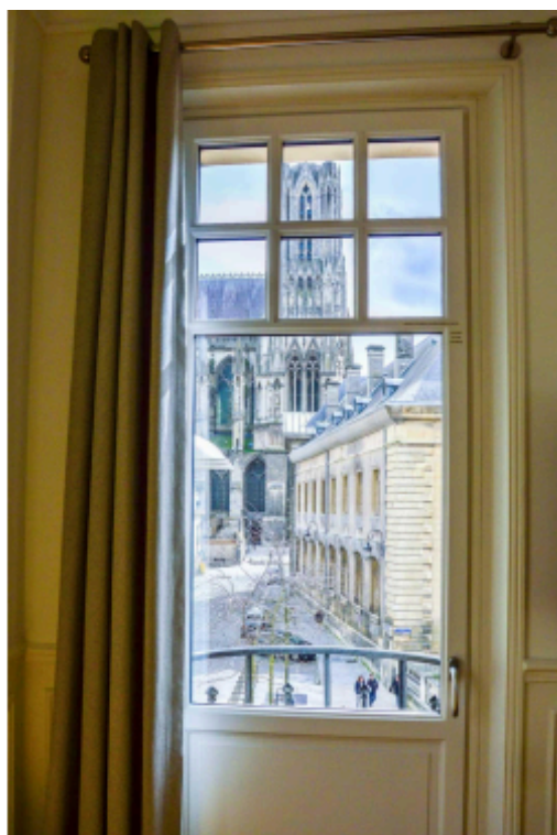
© Les Berceaux de la Cathédrale