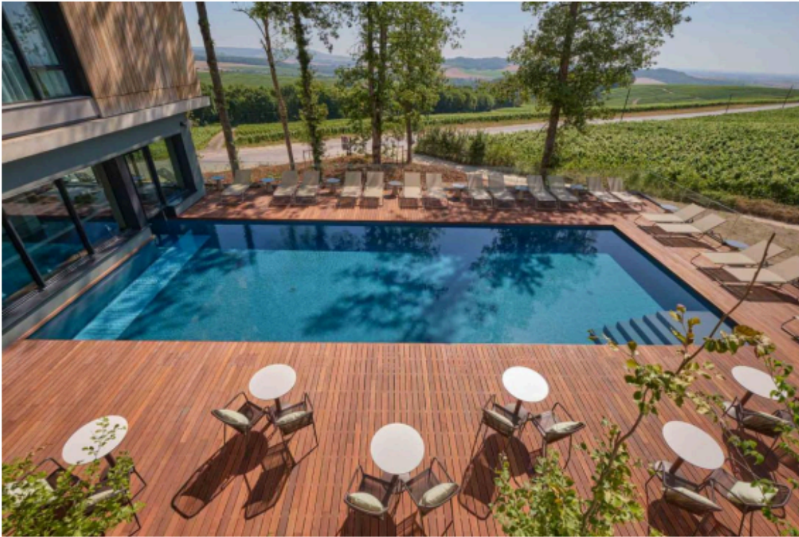
L'hôtel 4 étoiles en Champagne Loisium

Région historique jalonnée de châteaux et d'églises monumentales, sillonnée sur terre par les rangs de raisin et sous terre par un réseau de crayères classées à l'Unesco, voici la Champagne et nos hôtels 4 étoiles de Champagne préférés pour poser ses valises à Reims, Epernay ou dans les vignes.